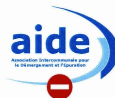
largeur : 30 mm