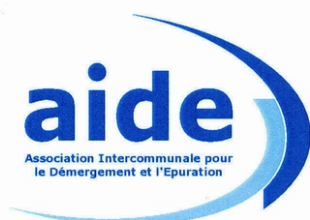
largeur : 40 mm