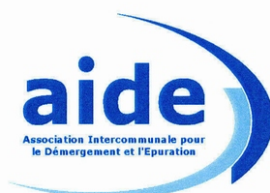
largeur : 35 mm